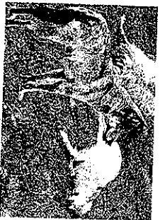
LUPO Pecore uccise sui colli tra Valdiesieve e Mugello

Successivamente ci sarà l'esibizione dei musicisti del Corto Storico della Repubblica Fiorentina e dei Bandieristi degli Uffici. Inteso anche il programma di manifestazioni previste a Rufina. Oggi alle 16 nella limonaia di Villa Poggio Reale ci sarà una proiezione dedicata a «Micolologia: la divulgazione e la prevenzione» a cura del gruppo Micologico Fiorentino P.A. Micheli. Alle 18, sempre in villa Poggio Reale, presentazione del libro «Sedie vuote, gli anni di piombo della parte delle vittime», con lecture a cura del Piccolo Teatro di Rufina. Infine alle 20,30 in piazza Umberto I sfilata di moda birnbi a cura dell'Associazione Commercialisti di Rufina.